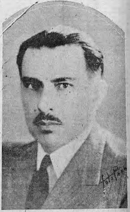
LICENCIADO DON TEODORO PICADO

Para su publicación nos entregó ayer el señor Presidente de la República las siguientes interesantes cuartillas en las que se refiere a los sucesos acaecidos al despuntar el día martes pasado: "Parece no haber complicado a algunos miembros de la oposición la actitud adoptada por mí después de abortado el golpe que preparaban para la noche del lunes al martes pasados pues