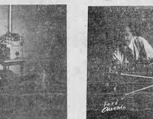
Muestran las gráficas varios aspectos de las sesiones que en la Conferencia del Café está celebrando el bloque Centro América...